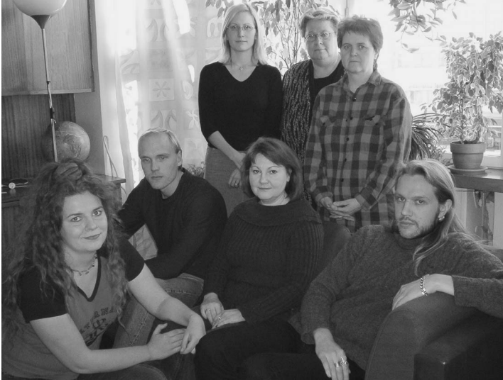
Tukipiste Laturin henkilökuntaa.