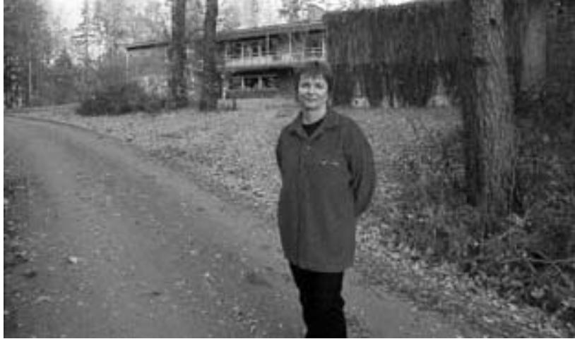
Kartanoyhteisön vastaava ohjaaja pihapiirissä.